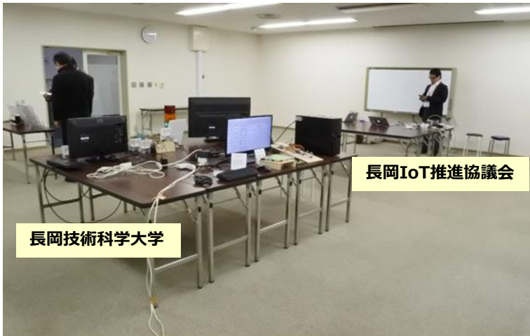
◀ デモンストレーション会場の様子