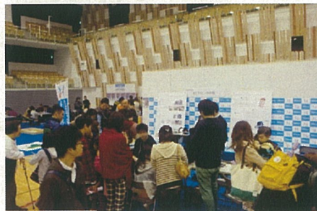
図 ものづくりフェアの様子