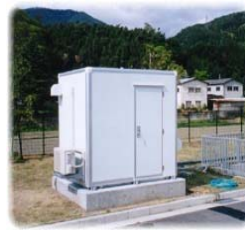
通信機器用収容箱