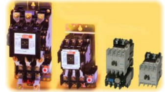
電磁接触器・開閉器

2002年4月に日立製作所から分離、統合し、『日立産機システム』の中条事業所として新スタート。日立製作所からの創業製品を受け継ぎ、1999年度省エネ大賞を受賞したアモルファス変圧器をはじめ、開閉器、遮断器、H-NET(配電・ユーティリティ監視システム)、プログラマブルコントローラ、エアクリーナ、精密金型などの開発・設計・製造に取り組んでおり、技術の日立がすべての力を結集した最新鋭の工場です。