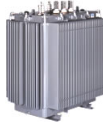
アモルファス変圧器